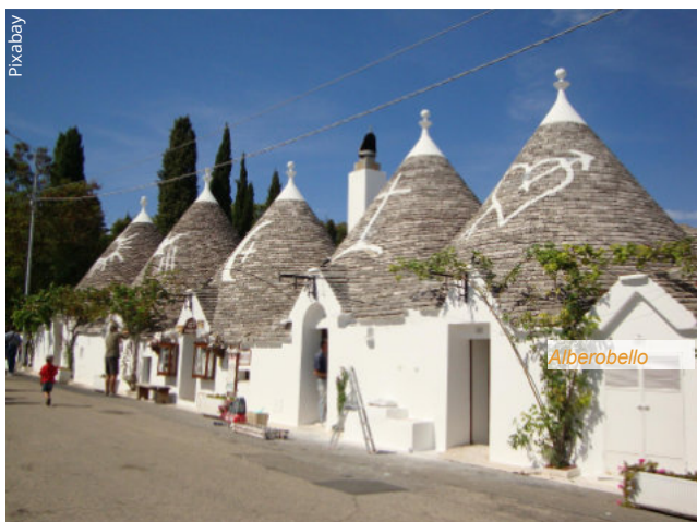
Photos et descriptions communiquées à titre indicatif et non contractuelles